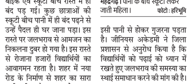
महेन्द्रगढ़। पानी के बीच स्कूटी लेकर जाती महिला।

हरिभूमि न्यूज ॥ महेन्द्रगढ़ सावन की पहली बारिश में कॉलेज रोड में जलभराव की स्थिति बन गई है। जलभराव के कारण कॉलेज मॉडल संस्कृत स्कूल एवं जीनियस अकेडमी में पढ़ने आने वाले छात्र-छात्राओं को भारी परेशानी का सामना करना पड़ा। वीरवार को करीब 50 बच्चों की बाइक एवं स्कूटी बीच रास्ते में ही बंद पड़ गईं। कुछ छात्राओं की स्कूटी बीच पानी में ही बंद पड़ने से उन्हें पैदल ही घर जाना पड़ा। इस रास्ते पर जलभराव से आमजन का निकलना दुबरा हो गया है। इस रास्ते से रोजाना हजारों विद्यार्थियों का आवागमन रहता है। शहर में नया रोड के निर्माण से शहर का सारा पानी इसी रास्ते पर जमा हो रहा है। जिसकी निकासी का कोई ठोस प्रबंध न होने से सभी को