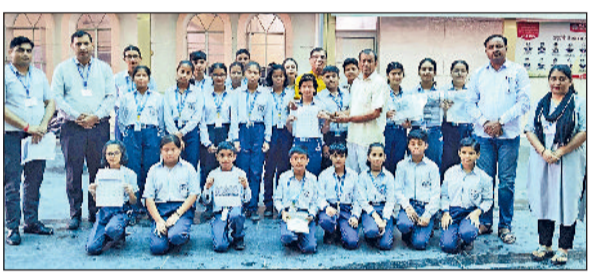
महेन्द्रगढ़। प्रतियोगिता के विजेता प्रतिभागी।