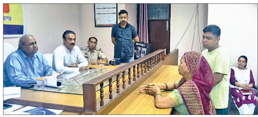
महेंद्रगढ़। शिविर में आमजन की शिकायत सुनते एडीसी।

उन्होंने बताया कि सप्ताह में दो दिन सोमवार और वीरवार को उपमंडल स्तर पर आयोजित समाधान शिविर में नागरिकों की समस्याओं पर सुनवाई करते हुए उनका समाधान सुनिश्चित किया जाता है, जिससे नागरिकों का शासन-प्रशासन में भरोसा समय के