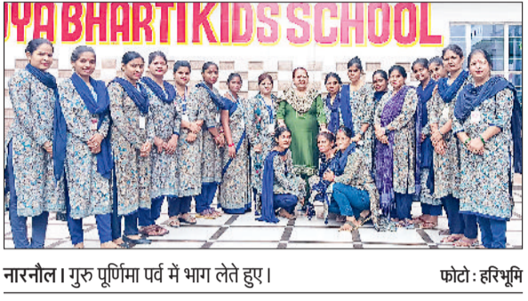
नारनौल। गुरु पूर्णिमा पर्व में भाग लेते हुए।