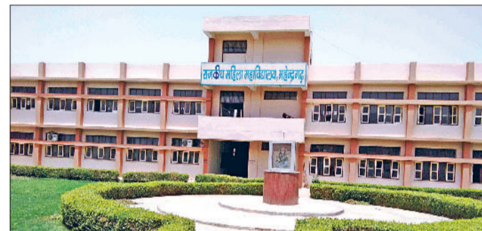
महेंद्रगढ़। राजकीय महिला कॉलेज महेंद्रगढ़।

स्नातक विषय में दाखिले के लिए दो मेरिट सूची व ओपन कार्डसिलिंग के बाद करीब 73 प्रतिशत सीटें खाली रह गई हैं। विभाग की ओर से दाखिले के लिए एक बार फिर से पोर्टल खोल दिया गया है। इस दौरान दाखिले लेने से वंचित रह गए विद्यार्थी 100 रुपये अतिरिक्त फीस देकर दाखिला ले सकेंगे। वहीं जिन विद्यार्थियों के आवेदन में गलती रह गई थी, वह भी आवेदन में सुधार कर दाखिला प्रक्रिया में भाग ले सकेंगे। बता दें कि जून माह में उच्चतर शिक्षा विभाग की ओर से स्नातक कोर्स के दाखिले का शेड्यूल जारी किया गया था। विभाग की ओर से कॉलेजों 14 से 17 मई तक पोर्टल पर डाटा अपलोड करने का समय लिस्ट जारी की गई थी। वहीं मेरिट लिस्ट में