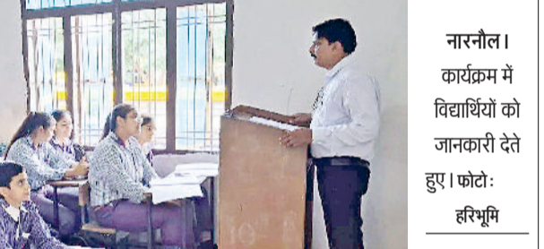
नारनौल। कार्यक्रम में विद्यार्थियों को जानकारी देते हुए।