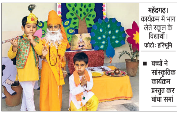
महेन्द्रगढ़। कार्यक्रम में भाग लेते स्कूल के विद्यार्थी।