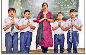
महेन्द्रगढ़ कार्यक्रम में भाग लेते स्कूल के विद्यार्थी।