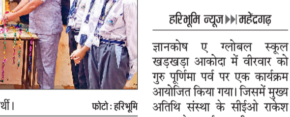
महेन्द्रगढ़। कार्यक्रम में भाग लेते स्कूल के विद्यार्थी।